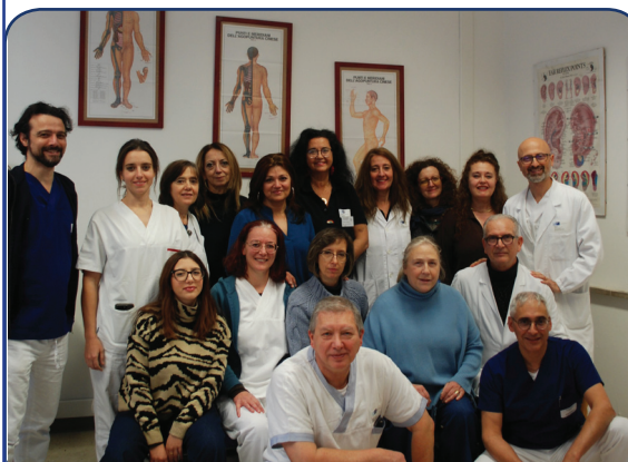
Lavorano a Fior di Prugna

lunedì, mercoledì e giovedì 14.30 - 19.00