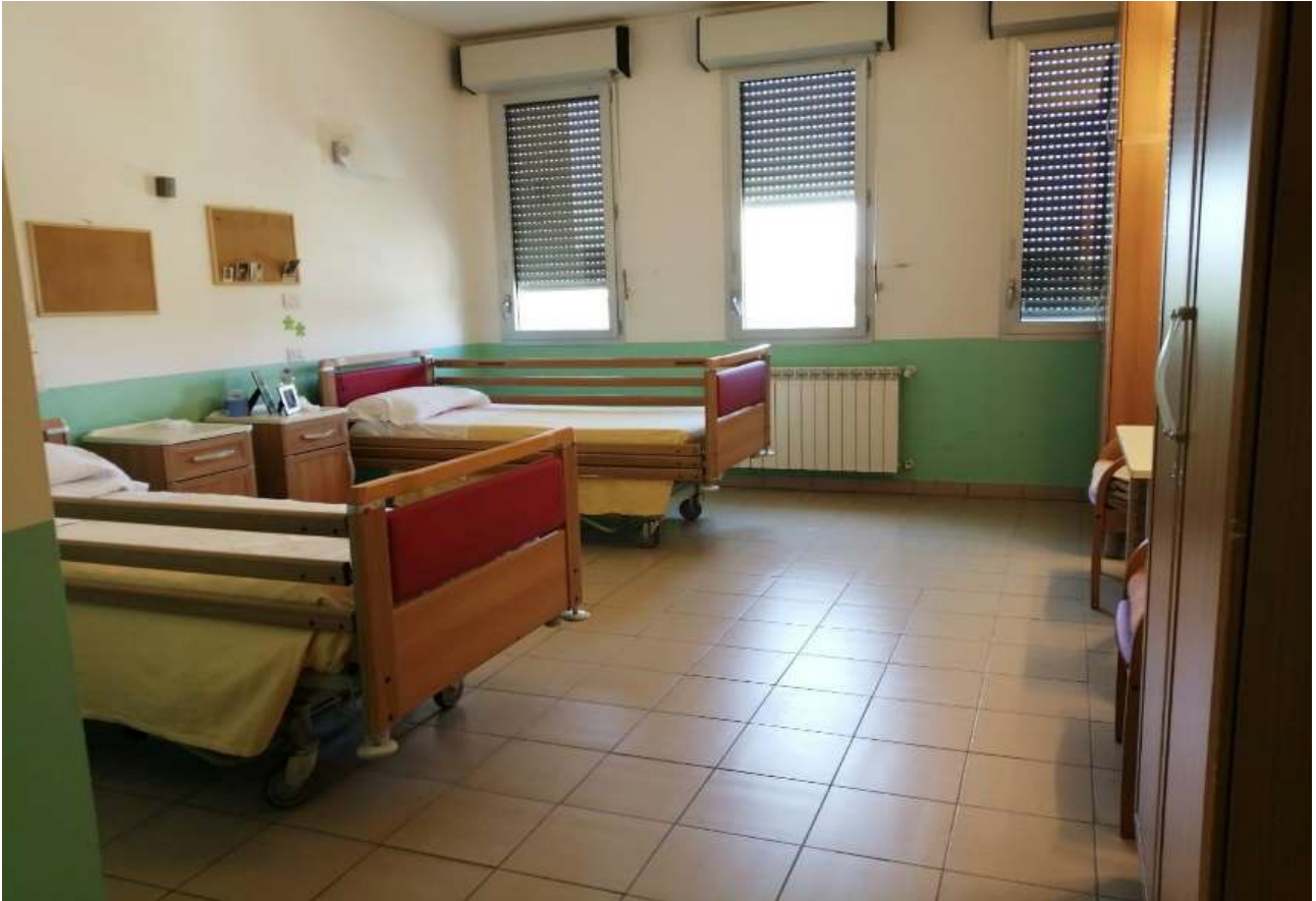
Figura 2 Camera tipo

La RSA è una struttura residenziale per persone anziane non autosufficienti gestita da una impresa sociale in regime di appalto per la ASL Toscana Centro; il servizio è inserito nella rete territoriale dei servizi socio- sanitari rivolti a persone anziane non autosufficienti.