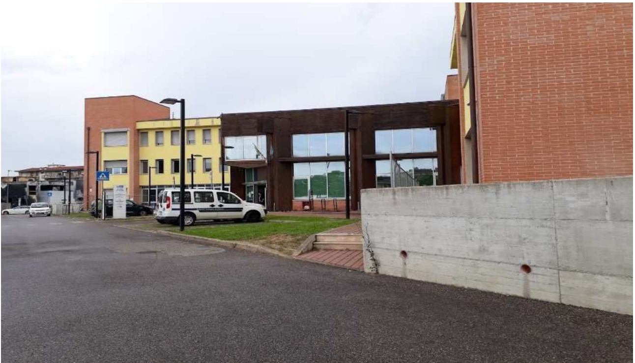
Figura 1 Spazio Esterno